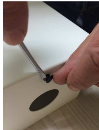
Treibstift mit Schraubenzieher heraushebeln