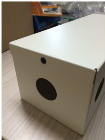
Nach schließen des Deckels Treibstift eindrücken